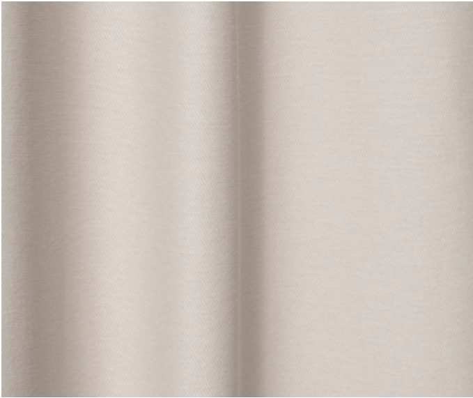
Lake 100 % Polyester FR 11 Farbstellungen 300 cm breit