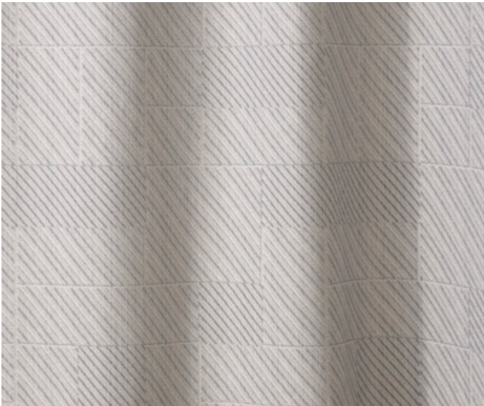
Utopia 100 % Polyester FR 10 Farbstellungen 300 cm breit